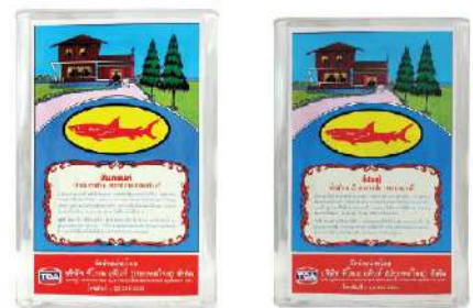
น้ำมันทาบ้าน สีแดงแก่

**ตัวอย่างสีเป็นเพียงเดคสีใกล้เคียง สีจะเข้มหรืออ่อนขึ้นอยู่กับสีของเนื้อไม้และจำนวนรอบสีที่ทา