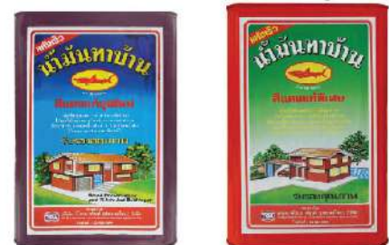
น้ำมันทาบ้าน สีแดงแก่ยุคใหม่